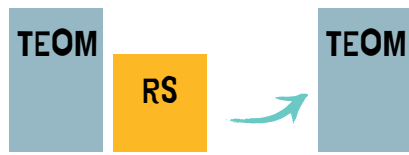
TEOM > RS RIEN NE CHANGE

Si La TEOM est inférieure à la RS : la TEOM est maintenue et sera ensuite déduite de la RS.