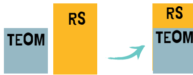
TEOM < RS MONTANT TEOM DEDUIT DE LA RS